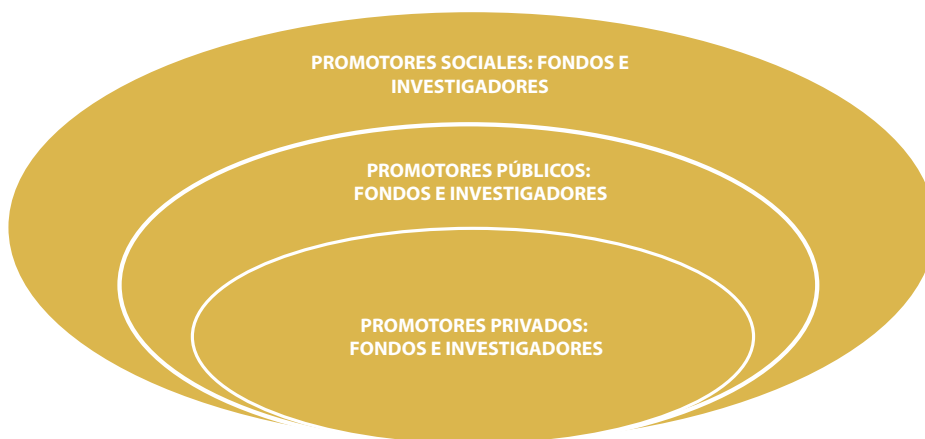
Figura 2. Hub de investigación en IA