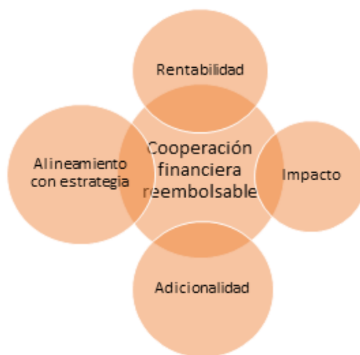
Figura 1. Atributos deseables de las inversiones realizadas con cooperación financiera - reembolsable