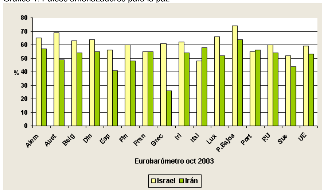
Gráfico 1. Países amenazadores para la paz

Ciertamente la encuesta no fue bien diseñada. En primer lugar, debía haberse incluido también a la Autoridad Palestina, y en segundo lugar no se entiende claramente si la amenaza percibida deriva de la actitud de Israel o del conflicto que le enfrenta con los palestinos y con algunos países musulmanes. Para aclarar el tema conviene recurrir a otra encuesta, la que Sofres realizó en julio pasado en Estados Unidos y en ocho países europeos, por encargo de The German Marshall Fund y la Compagnia di San Paolo. En esa encuesta se plantearon una serie de amenazas y europeos y americanos coincidieron en las cinco más graves: